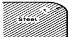
r > 2 mm Rounded edge, Good (G)